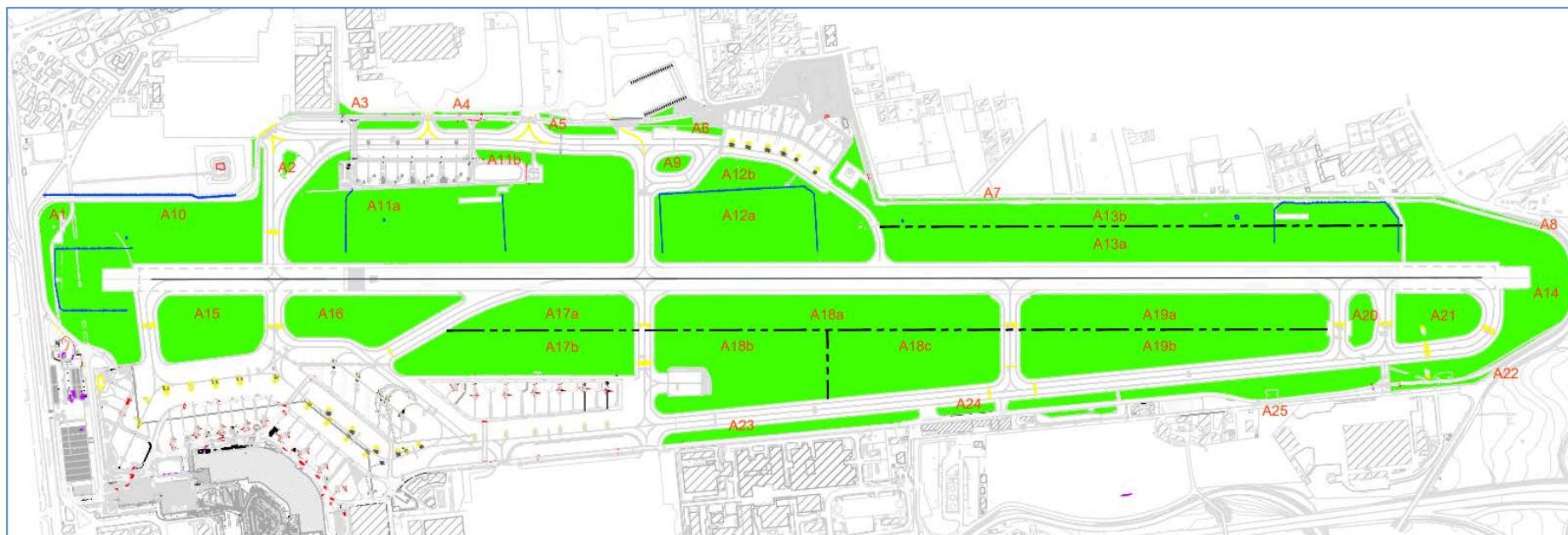
Planimetria 1 - Aree a verde ed area pavimentate